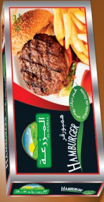
Hamburger de dinde Turkey Hamburger