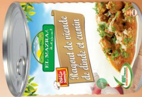
Ragoût de viande de dinde et cumin turkey meat with cumin sauce