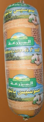
Saucisson à l'ail Garlic sausage