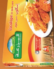
Escalope de dinde pané / breaded sliced turkey breast