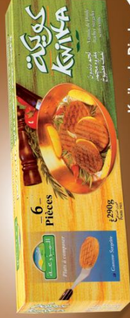
Kwika de Dinde Turkey Kwika