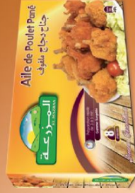
Aile de poulet pané / Breaded chicken wings