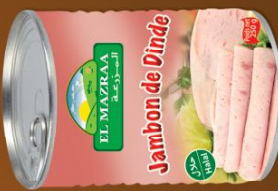
Jambon de Dinde Turkey Jambon