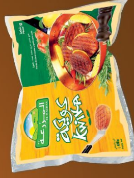
Kwika de Dinde Turkey Kwika