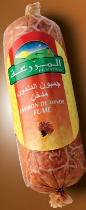
Jambon de dinde fumé Turkey smoked jambon