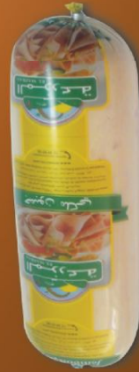
Jambon royal Royal jambon