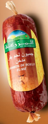
Jambon de bœuf fumé Beef smoked jambon