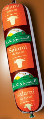
Salami de bœuf Beef salami