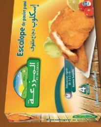
Escalope de poulet pané / breaded sliced chicken breast