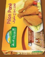
Pilon pané / Breaded drumstick