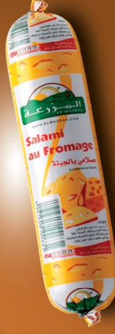
Salami fromage Mini salami with cheese