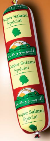
Super Salami Spécial Super special salami