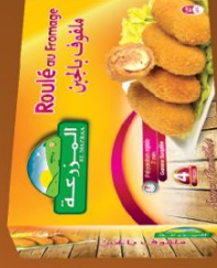
Roulé au Fromage / Cheese rolled