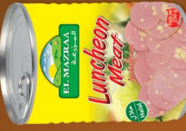
Luncheon Meat with cheese