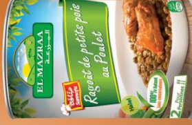
Petits pois au poulet Peas with chicken