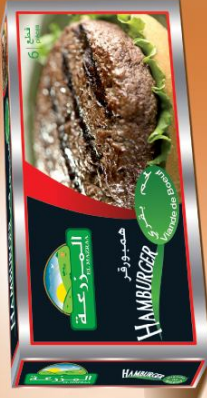
Hamburger de boeuf Beef Hamburger