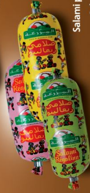
Salami pour enfant Salami for kids