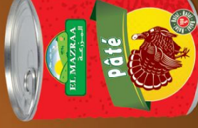
Pâté de Dinde Turkey Pie