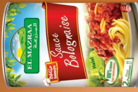
Sauce Bolognaise Bolognese sauce