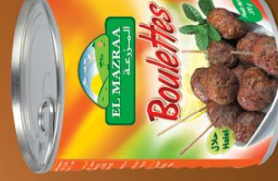
Boulettes de dinde Turkey balls