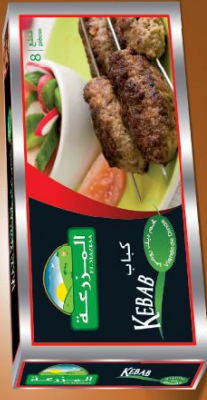
Kebab de dinde Turkey Kebab