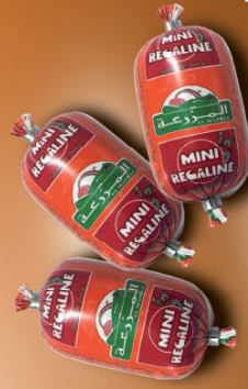
Mini régatine Mini régatine