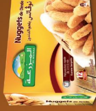
Nuggets de dinde / Turkey nuggets