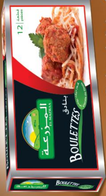
Boulettes de dinde Turkey Balls