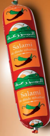
Salami de dinde mharhar Turkey salami mharhar (hot)