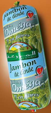
Jambon de dinde Oméga 3 Omega 3 Turkey jambon