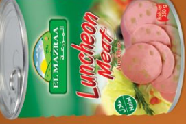
Luncheon Meat with Olive