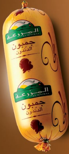
Jambon de dinde Turkey jambon