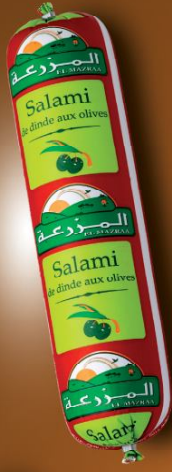
Salami de dinde aux olives Turkey salami with olives