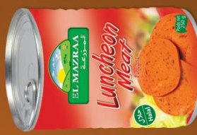
Luncheon Meat Hot