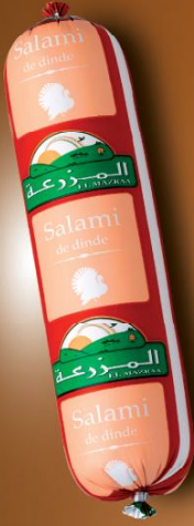
Salami de dinde Turkey salami