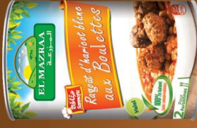
Bean with turkey balls