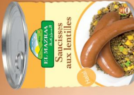
Sausisses aux lentilles Stew with peas and sausage